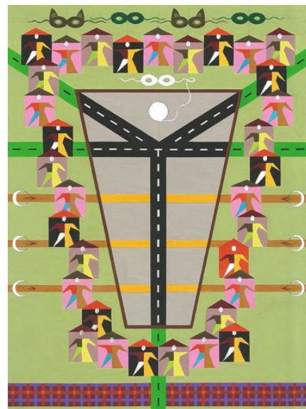
Legend: Wolf Corridor , 2021*