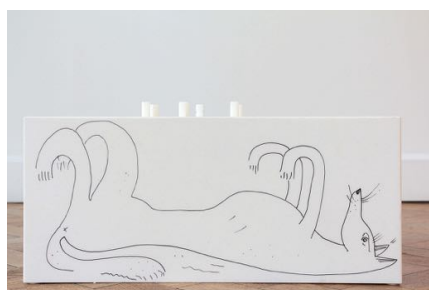
Dwarf Parade Dog (Sugar Nipples) , 2017*

De Kempen worden van oudsher gekenmerkt door illegaliteit en een volstrekt eigen mores. Zo staat het grensgebied niet alleen bekend om de schapenteelt, maar sinds de middeleeuwen ook als rovershol en als streek waar achter de pittoreske gevels van boerderijen allerlei activiteiten plaatsvinden die het daglicht niet kunnen verdragen, zoals smokkel van boter en drugs. In zijn onderzoek naar de Kempen kijkt Bosmans met een caleidoscopische blik om zich heen. Zo valt zijn oog op de 'herdgang' – een driehoekig plein dat een rol speelde bij de middeleeuwse schapenhouderij – en verdiept hij zich in de archeologische vondst van de eerste druppel brons in een Tilburgse smeltkroes. Ook bestudeerde hij de lokale huishoudtradities. Het oude gebruik waarbij vrouwen de vloer schrobden met zand dat ze eerst in decoratieve patronen uitstrooien, zette Bosmans bijvoorbeeld aan tot het maken van zandsculpturen.